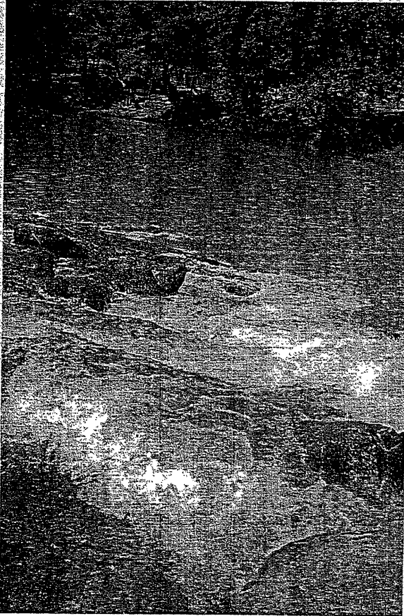
Para enfrentar problemas em bacias hidrográficas, ...

Antecipando-se ao que deverá resultar da aplicação da cobrança na despoluição do Paraíba do Sul, a ANA tem viabilizado a construção de estações de tratamento de esgoto desde o ano passado. A abordagem do programa é inovadora: não se financiam obras nem equipamentos, mas paga-se pelo resultado final que é o esgoto tratado. Em 2001, o programa recebeu solicitação para continuação de 104 empreendimentos em 19 bacias hidrográficas. Em função da disponibilidade orçamentária, foram contratados 17 empreendimentos que vão reduzir 81.000 Kg de carga orgânica (DBO) por dia. Todo o recurso sob responsabilidade da ANA, no valor de R$ 52 milhões, foi integralmente empenhado e repassado ao agente financeiro do programa, a Caixa Econômica Federal, para compor o Fundo Nacional de Despoluição de Bacias Hidrográficas. Os recursos serão liberados na medida que cada empreendimento estiver funcionando, conforme estabelecido no contrato.