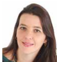
Simone Nogueira Siqueira Castro Advogados