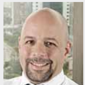
Werner Grau Neto Pinheiro Neto Advogados