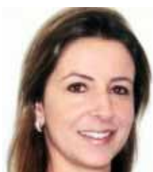
Ana Luci Grizzi Veirano Advogados