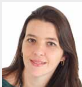
Simone Nogueira Siqueira Castro Advogados