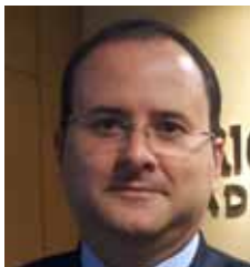
Ricardo Carneiro Ricardo Carneiro Advogados