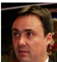
Luciano Cota Azurit Engenharia e Meio Ambiente