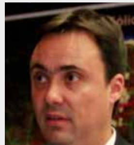
Luciano Cota Azurit Engenharia e Meio Ambiente